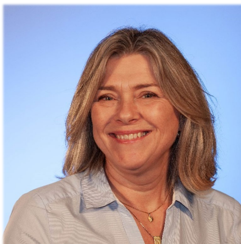
Helle Øien Administrasjon og Kurs/Kompetanse